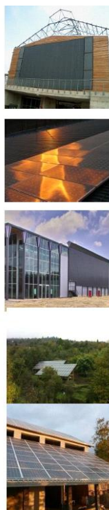
Figura 1 Dati relativi all'impianto fotovoltaico