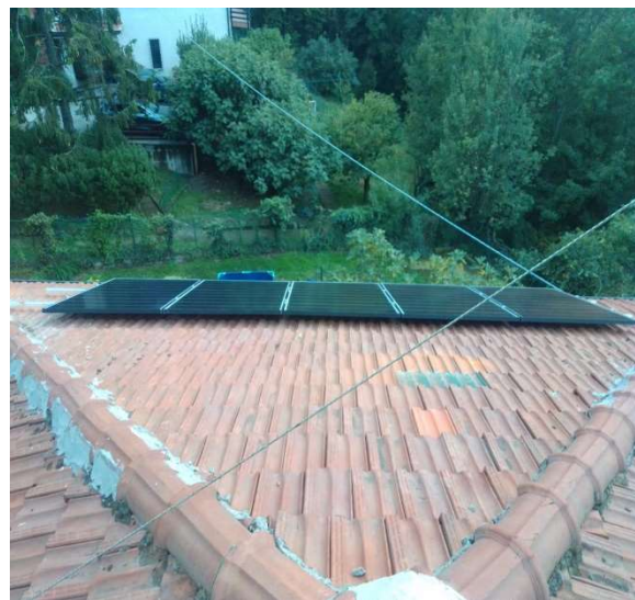
Foto 3 - 4. Impianto fotovoltaico terminato

L'installazione dell'impianto fotovoltaico prevede la posa dei moduli sulla copertura inclinata attraverso l'utilizzo di staffe in alluminio avvitate alla struttura secondaria della copertura a cui sono fissati i profili in alluminio per mantenere l'integrità del manto di copertura esistente.