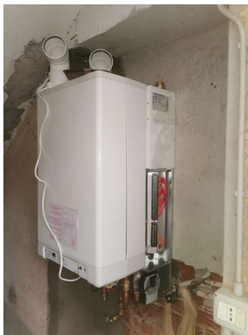
Foto 1. Macchina esterna pompa di calore Hybrid

Interventi di efficientamento energetico