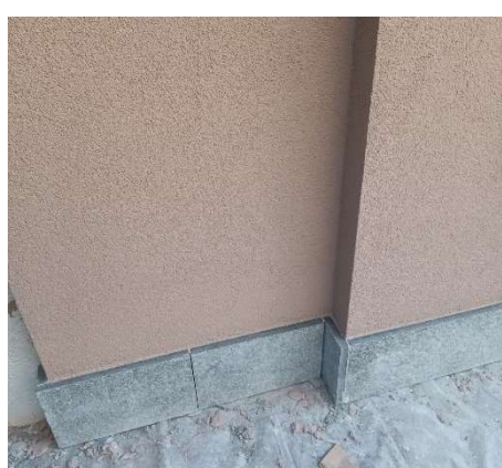
Foto 5. Materiale isolante in cantiere